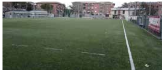
CENTRO SPORTIVO SAN PAOLO - VIALE ITALIA 15 - CANELLI (AT)

Studio di Consulenza Fiscale e Societaria